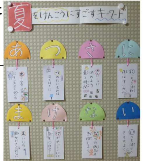
保健室前の掲示板より

家の仕事を手伝う、オリンピック・パラリンピックをテレビで観戦する、本を読む、自主学習に取り組むなど、家でできることでも、心から感動したり、五感を使って考えたり、失敗しもう一度挑戦したりすることができ、子どもにとり貴重な経験になります。普段できないことを計画し、実行してほしいと思います。