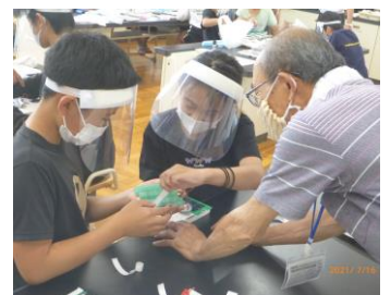
HOT けん桜谷隊さんに こつを教えてもらう6年生

雲の隙間から太陽の光が差し込むとスクリューがくるくる回り始め、6年生は、満面の笑みでボートを水に浮かべていました。製作を通してエネルギーについて考えるきっかけにもなったようです。「日本は、人口の割にエネルギー消費量が多い」と気づいたり、今後は、「使わない電気を消す」「エコバックを持参する」「車ばかりに頼らずに自転車や徒歩でも移動する」と考えたりしていました。