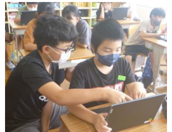
6年生にタブレットの 使い方を教えてもらう5年生

5年生はわからないことがあるとすぐ教えてもらうことができるため、わずか1時間で随分上達しました。6年生は、人に教える難しさとともに人に喜んでもらった喜びを感じることができたようです。2学期には5、6年生に、今度は1～4年生に教えに行ってもらおうと考えています。