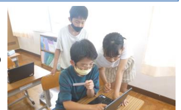
タブレットを教え合う6年生