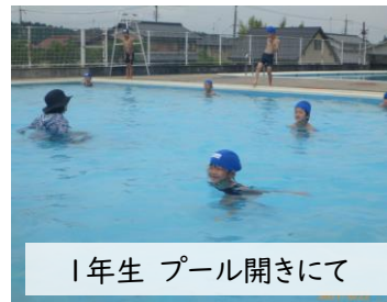
1年生 プール開きにて

初めての日は子どもたちは朝から興奮気味でした。一方、久しぶりの水泳学習で水を怖がる様子の子もいました。まずは安全第一で水遊びや水泳運動の楽しさに触れ学年に応じた技能を身に付けられるよう、努めていきたいと思えます。