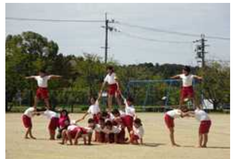
We love Hino. We love Sakuradani (上学年)