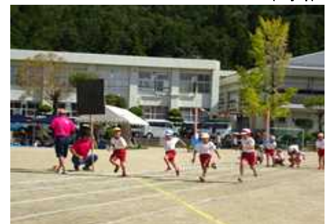
頑張れ!! 50m走 (低学年)