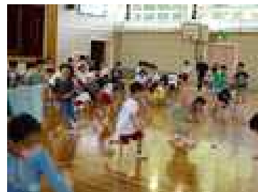
追いかけて玉入れ

が入った楽しい障害物でした。さすが、6年生が知恵を絞って考えてくれた内容でした。ご苦労様でした。