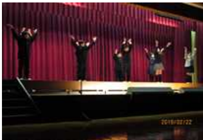
ダンスメドレー(6年生)

2月22日(金)は、大勢の保護者や地域の方々にご来校いただき、「六年生を送る会(六送会)」を開催することができました。ご多用の中、ありがとうございます。今年1年間お世話になった6年生への感謝の気持ちを込めたとても温かい雰囲気の中になりました。先日の児童会の引継式で全校のリーダーを6年生からバトンタッチした5年生が中心となり「6年生の心に残る楽しい六送会にしよう」をテーマに、各学年で6年生の人たちに喜んでもらえるような出し物を考えました。その結果、どの学年も劇となりましたが、限られた時間の中でよく頑張っ練習し、素晴らしいものに仕上げることができました。当日は、低学年の「桃太郎」や「かさこじぞう」などの昔話から5年生の「スーパーマリオ5年生」まで、楽しく工夫された劇が発表されました。