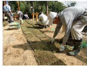
↑芝植えをしてくださる HOT けん桜谷隊さん

本年度もJA様からグリンピース基金事業で12万円寄贈いただきました。基金の用途として、裏山の芝生の土やパンジーの花の種。また、子ども達が育てる野菜畑の土や肥料。そして、飼育ケースや採集網、などを購入させていただきました。