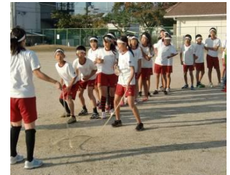
合同体育祭8の字とび(174回)第3位

10月には、修学旅行、社会見学旅行がありました。どの学年も晴れた日に、欠席者もなく、実施することができ、楽しい旅行となりました。保護者の皆様には準備等、お世話になりありがとうございました。秋は、スポーツの秋、読書の秋、芸術の秋などと言いますが、子どもたちは、合同体育祭、自由研究発表会、読書感想文・絵画・立体・書写などの作品づくり等、自分の得意な分野で力を発揮することができました。20日からは、マラソン大会に向けた練習も行っています。自分のめあてに向かって自分なりに努力している姿は、すばらしいと感じます。このような取組を通して「やりきった」という経験を増やしていきたいものです。11月20日(木)がマラソン大会です。子どもたちのやりきったという満足の笑顔がたくさん見られるよう、励ましていきたいと思います。今月もご協力の程、よろしくお願ひします。