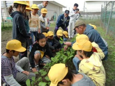
日野菜の間引き・土寄せ

桜谷のよさを知るために、各学年で地域学習を行っています。1年生は、裏山での春見つけや秋見つけを行っています。2年生は、ビオトープでの魚の観察や裏山等での生き物探し、3年生は、裏山での樹木学習やスクール農園での日野菜学習を行っています。4年生では、裏山等でのバードウォッチングも行いました。5年生は、田んぼの学習や川の学習を進めています。6年生は、近くのお城の跡のフィールドワークなどを通じた歴史学習を始めました。どの学習も、地域の方に学習ボランティアとして教えに来ていただき、体験を通しての有意義な学習となっています。この豊かな自然や文化、歴史に触れ、学んでいく中で、桜谷のよさを体感し、桜谷を誇りに思える子どもたちを育てていきたいと考えています。