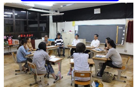
地区別の話し合いの様子

後半は地区ごとに分かれて、「子育てに大事な親の役割について」をテーマに懇談をしました。短時間ではありましたが、主任児童委員さんや民生委員さんにも加わっていただき、どの地区も大変有意義な話し合いがもたれたようです。お礼申し上げます。