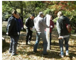
石楠花池周辺での植樹