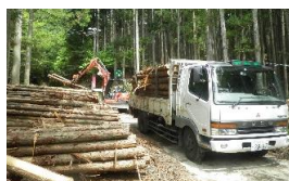
仕分け・積み込み作業