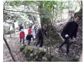
遊歩道散策の様子

午前中、イロハモミジ・クヌギ・ヤマザクラなど12本の植樹と、枯損木の片付け。午後には一部の方がクラフトされる他、改修された木橋を渡り、生活環境保全林から石楠花群落も散策され、秋の一日を満喫されました。