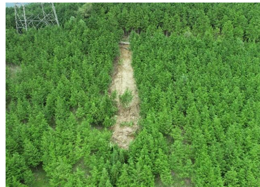
大字熊野千本野地先(ドローン撮影)