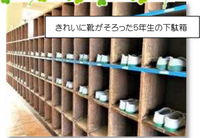
きれいに靴がそろった5年生の下駄箱

例えば、今5年生が「はきものをそろえる」という実践を始めました。昇降口の「はきものをそろえる」の掲示の通り、「靴をそろえる」ことから「生活を整える」「心を整える」ことをめざしています。この実践が自発的に継続され、それが他の学年にも広がり、また「トイレのスリッパをそろえる」ところまで広がっていくよう根気強く見守り、支援していきたいと思えます。