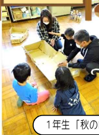
1年生「秋の自然」を使った遊びコーナー