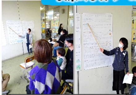
5年生 一人1レポート&発表