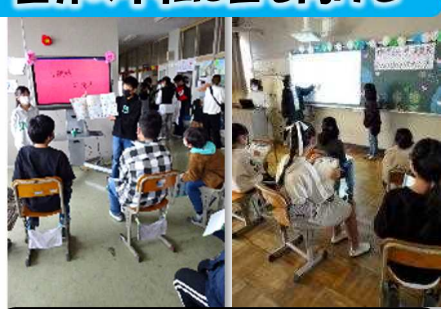
6年生「構成」がしっかりしていて説得力のある発表

5年生は、社会科や「たんぼのこ」で学んできた「米づくり」について発表しました。驚きだったのは「一人1レポート」だったこと。一人ひとりが、自分が探求したい「テーマ」を設定し、今までの学習やインターネット等から必要な情報を集め、模造紙にまとめました。テーマ設定の理由や感想もしっかり伝えられて素晴らしかったです。 6年生は、戦争・平和学習のまとめや世界の国々に目を向けて、世界の「子ども」を取り巻く問題、地球温暖化や自然災害等の環境問題等について、タブレットを活用し、分かりやすいプレゼンを完成させ、「自分の言葉」で熱く思いを伝えました。さすが最高学年と思わせる立派な発表でした。