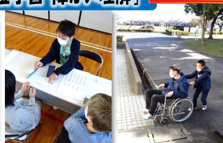
4年生「体験」を通じて伝える発表