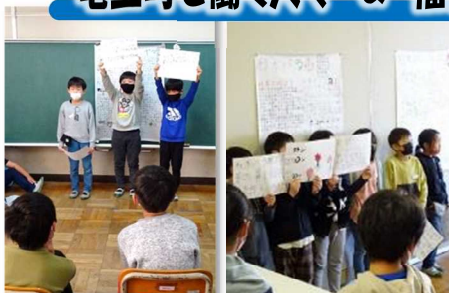
3年生 内容が充実した壁新聞と堂々とした発表

4年生は、今まで体験的に学んできた「福祉学習」のまとめを発表し、さらに実際に体験してもらう形で伝えることができました。車椅子体験や高齢者体験、点字打刻体験、そして手話教室の4つの体験を用意し、自分たちが「教える側」に立つことで、大変説得力のある発表になりました。