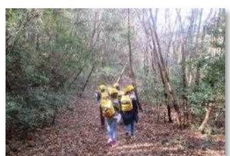
秋の鏡山をハイキング