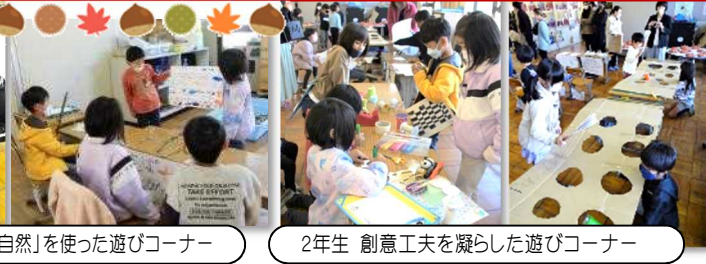
2年生 創意工夫を凝らした遊びコーナー

1年生は生活科で集めた「秋の自然」…どんぐり、まつぼっくり、木の葉、小枝等を使っておもちゃを作り、2年生の子どもたちや保護者にみなさんに楽しんでもらいました。遊び方を分かりやすく説明し、遊びの進行も上手にできました。