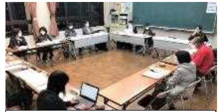
10/28 第2回学校運営協議会 「鏡山プロジェクト」について協議

まずは、リーディングプロジェクトとして、「鏡山プロジェクト」から着手することになりました。11月14日（土）には、学校運営協議会委員と学校教職員で実際に鏡山ハイキング（登山）を行い、鏡山の自然や歴史的な魅力について学び合い、教材化への方策をさぐる予定になっています。