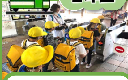
JR 近江八幡～長浜・鉄道スクエア