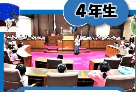
県庁防災センター・大津市科学館

県庁で防災の学習をしました。また県議会の議場に入って議員席に座らせてもらいました。