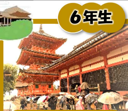
銀閣・八坂神社・清水寺