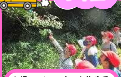
河辺いきものの森・布施公園