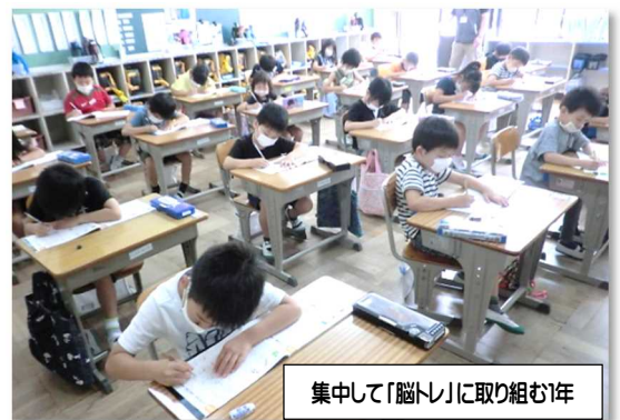
集中して「脳トレ」に取り組む1年

保護者の皆様には、1学期間、多大なご理解とご協力を賜り本当にありがとうございました。例年になく短い夏休みとなりますが、子どもたちにとって、ご家族にとって有意義な夏休みにしていただきたいと思います。