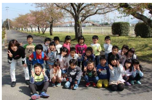
『桜の木の下で』1年2組