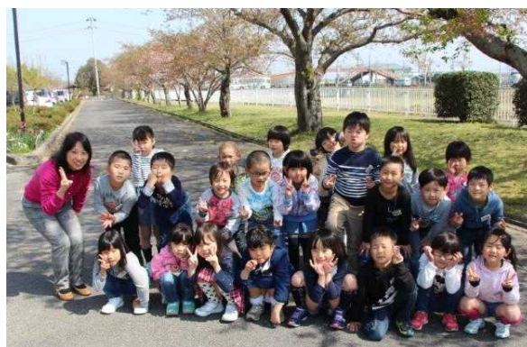
『桜の木の下で』1年1組

それぞれの学級、個人で桜の木の下で写真を撮りました。ここでは、紙面の都合上1年生の集合写真のみを掲載します。